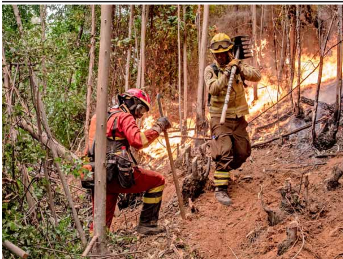
Un brigadista de la Unidad Militar de Emergencia de España (izquierda) trabaja junto a otro chileno en la contención de un foco en la Región del Biobío. El último reporte del Gobierno indicaba que ayer había 256 incendios en todo el país, de los cuales 77 estaban siendo combatidos. La superficie quemada llegó a las 439 mil hectáreas.

EJECUTIVO BUSCA ENVIAR EL PROYECTO AL CONGRESO DURANTE ESTE AÑO | B 1