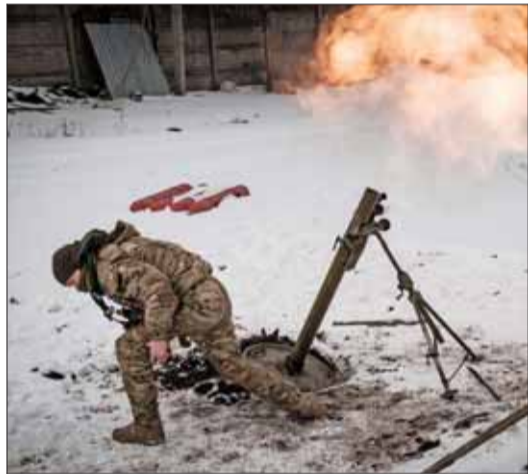
Un militar ucraniano se protege luego de lanzar un disparo de mortero hacia posiciones rusas en Bakhmut.

► A casi un año de la invasión lanzada por Moscú, las cuentas de los consumidores europeos casi se han triplicado. | A 4