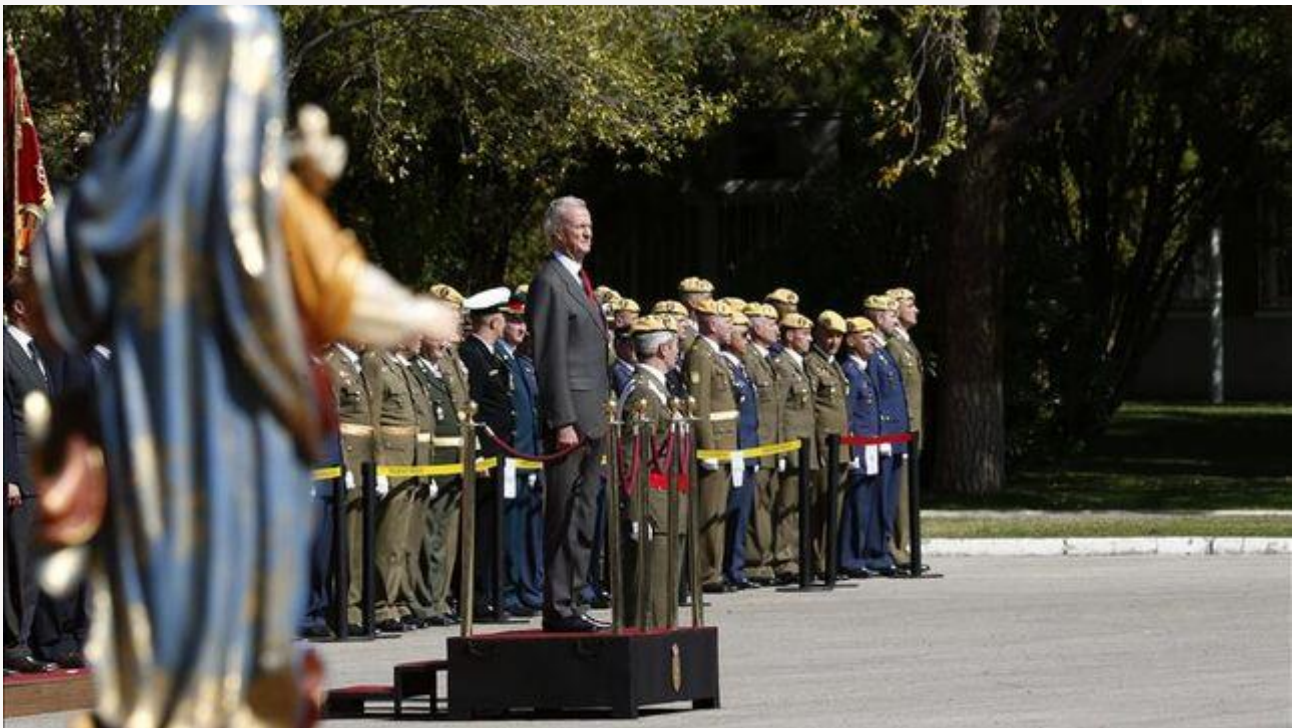
Morenés destaca la utilidad y capacidad integradora de la UME en el X aniversario

La Unidad Militar de Emergencias (UME) ha celebrado hoy su X aniversario con un acto presidido por el ministro de Defensa, Pedro Morenés, quien ha resaltado el "acierto" de su creación, su utilidad y capacidad integradora, que demuestra la aportación de las Fuerzas Armadas a la sociedad.