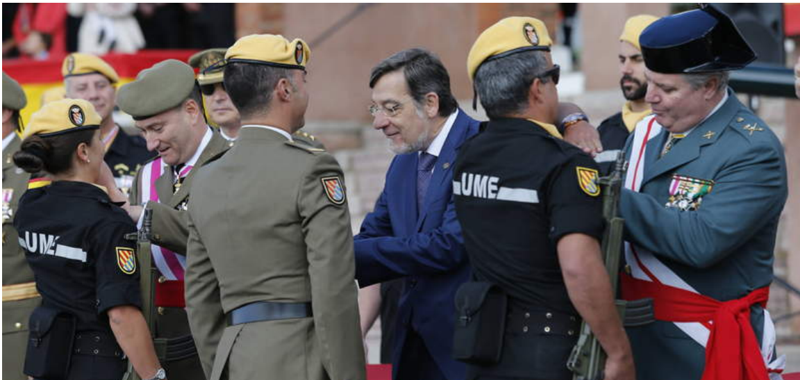
Imposición de medallas en el acto castrense de la UME; en primer término, el general de zona de la Guardia Civil. -

El quinto batallón de la UME celebra con un emotivo acto castrense los diez años de vida de una unidad militar «consolidada, reconocida y cercana» a la sociedad civil .