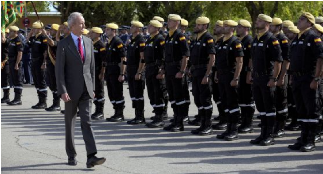
El ministro de Defensa, Pedro Morenés, preside el acto del 10 aniversario de la UME.

MIGUEL GONZÁLEZ MADRID 7 OCT 2015 - 21:40 CEST