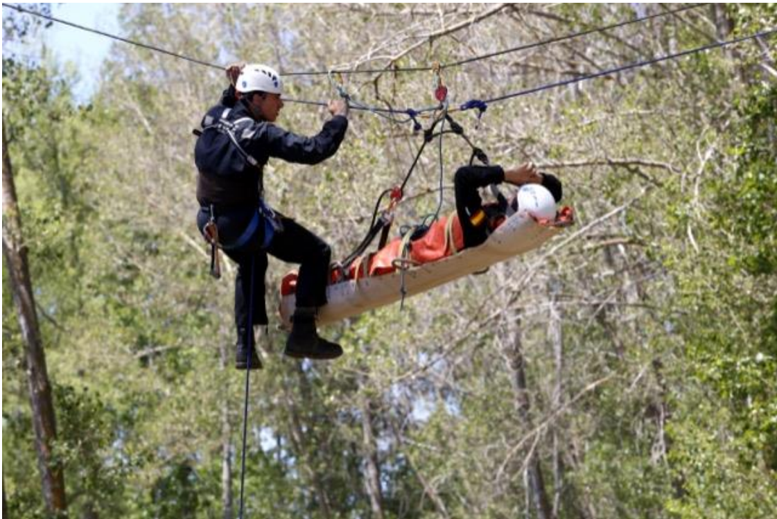
Simulacro de rescate de la Unidad Militar de Emergencias (UME) en la Base Conde de Gazola de la localidad leonesa de Ferral del Bernesga

La Unidad Militar de Emergencias, una idea del Gobierno de José Luis Rodríguez Zapatero, celebra sus primeros diez años de vida, un tiempo en el que ha realizado más de 300 intervenciones, 132 de la unidad asentada en León.